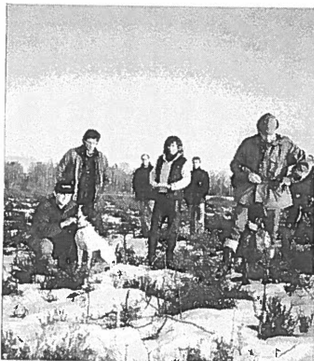
Vinnere av klubbmesterskap lavland, Pointer Kaia og Strihåret Vorster Sebb