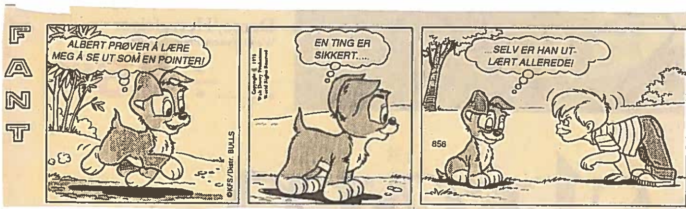
Fra en av timene ved fuglehundskolen